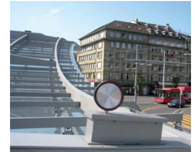
Der Baldachin in Bern, Bahnhofplatz 2500 m 2 Glasfläche mit CITYGARD geschützt

Die Vögel, die sich im geschützten Bereich absetzen, verlassen den Platz recht schnell und meiden die geschützten Gebäude dauerhaft. (Vergrämungseffekt)