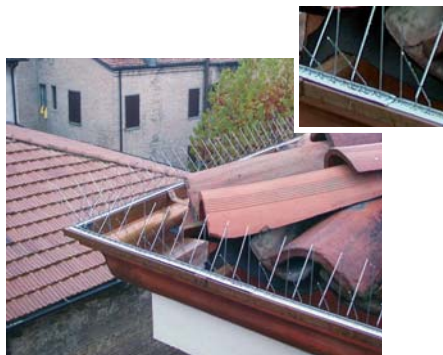
RATEX - Taubenabweiser