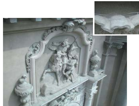
RATEX - Elektrosystem