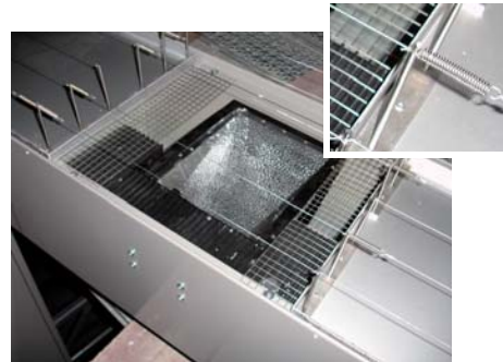
RATEX - rostfreie Verdrahtung (RV)

Auf unsere Taubenabwehrarbeiten gewähren wir eine Garantie von 5 Jahren.