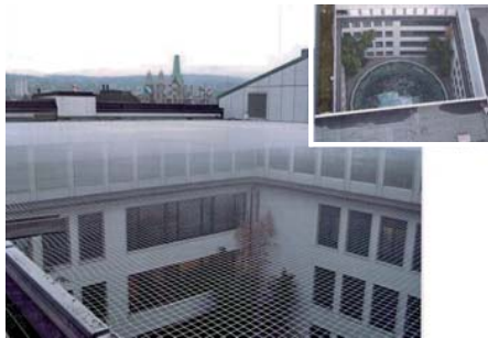
RATEX - transparente Vernetzung

Wir beraten Sie fachmännisch für eine günstigste und ästhetische Lösung Ihrer Tauben- oder Kleinvogelprobleme. Eine Auswahl unserer hervorragenden mechanischen Schutzsysteme: